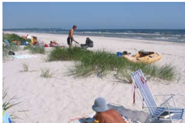
Falsterboväset har ca 40 km stränder.