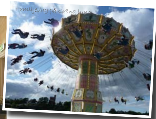
I Stockholm finns möjlighet till många roliga aktiviteter.