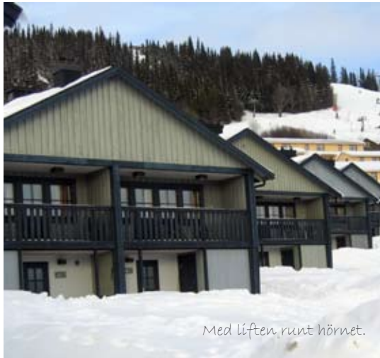
Med liften runt hörnet.