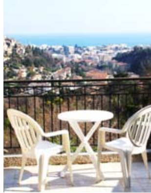
utsikt från terrassen

Inom bekvämt bilavstånd finns många museer, utmärkta golfbanor och förstklassiga restauranger.