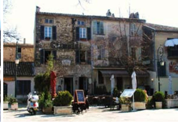
Torget i Haut de Cagnes